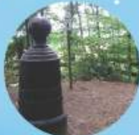
BONHOMME DE FER