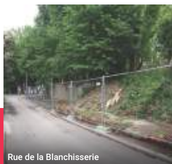
Rue de la Blanchisserie

Service Environnement - 067/874.877 à 880, environnement@7090.be Échevin de l'Environnement - 0477/744.198, leandre.huart@7090.be