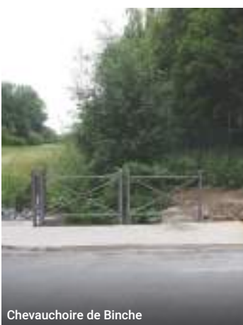
Chevauchoire de Binche

Lutte contre les inondations – curage de la Brainette