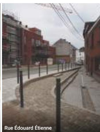
Rue Édouard Étienne

Élargissement de l'accotement et sécurisation des abords du ruisseau