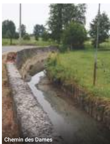
Chemin des Dames

Rénovation et entretien des bâtiments communaux – placement de panneaux acoustiques